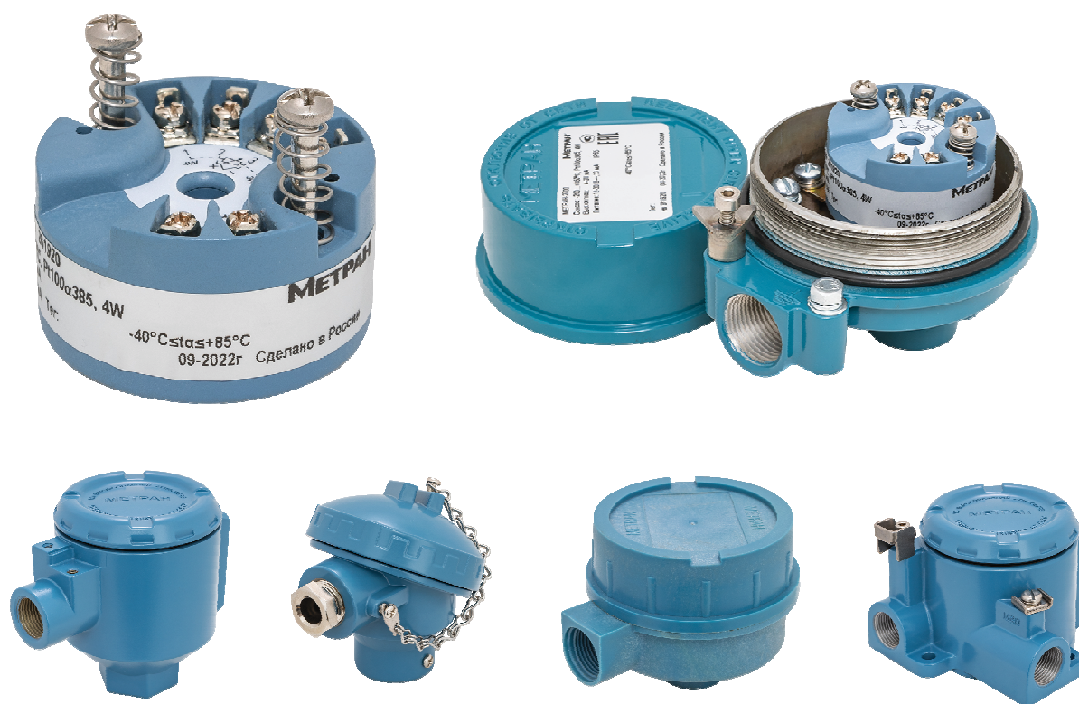
Рисунок 1 – Общий вид преобразователей

Общий вид преобразователей представлено на рисунке 1.